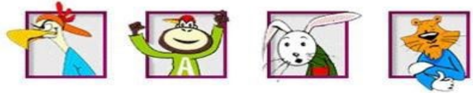
Figuur 3: Kanjertraining gedragstypen: De pestvogel (blauwe pet), de aap (rode pet), het konijn (gele pet), en de tijger (witte pet).

Graag verwijzen wij u voor meer informatie naar de website van de Stichting Kanjertraining: