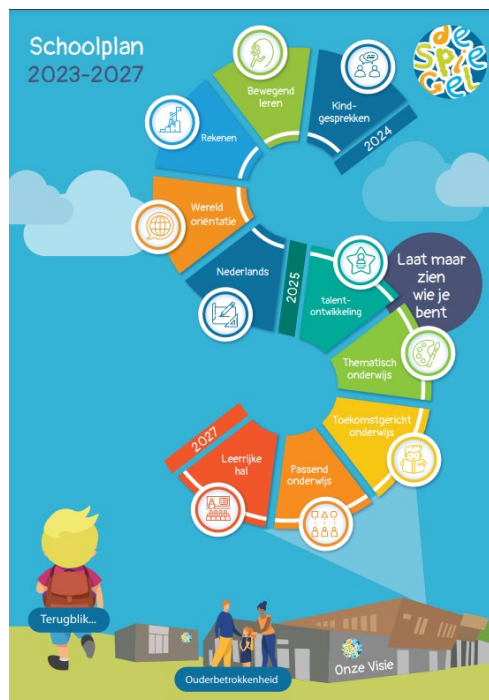
Figuur 5: Schoolplan 2023-2027.

Het schoolplan met bijlagen staat ter inzage op de website van de school, en kunt u hier vinden. We hebben ons schoolplan in het volgende beeld vormgegeven: