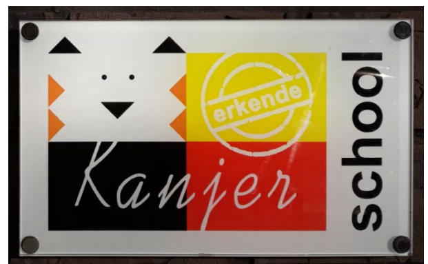
Figuur 1: Erkend Kanjerschool.

Het team is gecertificeerd voor het geven van kanjerlessen. De Kanjertraining is één van de door de overheid gecertificeerde programma's (Stichting Kanjertraining) om pesten tegen te gaan. De kanjertrainingen worden in alle groepen gegeven. We zorgen ervoor dat iedere week een kanjeractiviteit (les, spel, oefening) aan bod komt. Het is goed dat ouders ook iets meer weten over de achtergronden van de kanjertraining. Alleen zo is te begrijpen waar wij mee bezig zijn, en kunnen we elkaar aanvullen en ondersteunen.