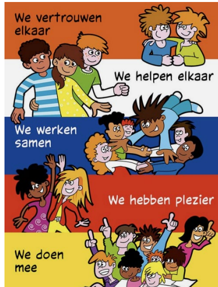
Figuur 4: De kanjerafspraken.